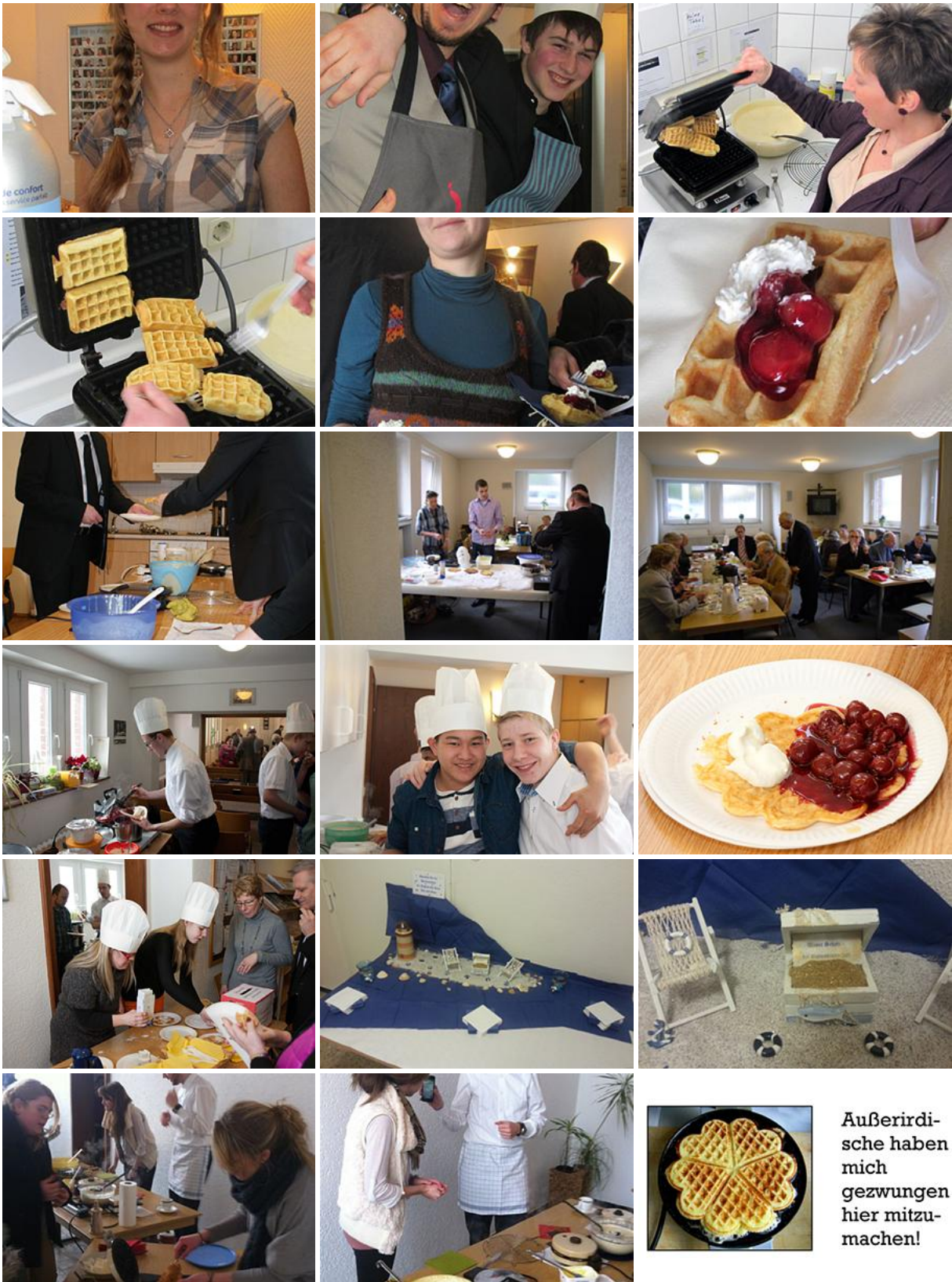
Außerirdische haben mich gezwungen hier mitzumachen!